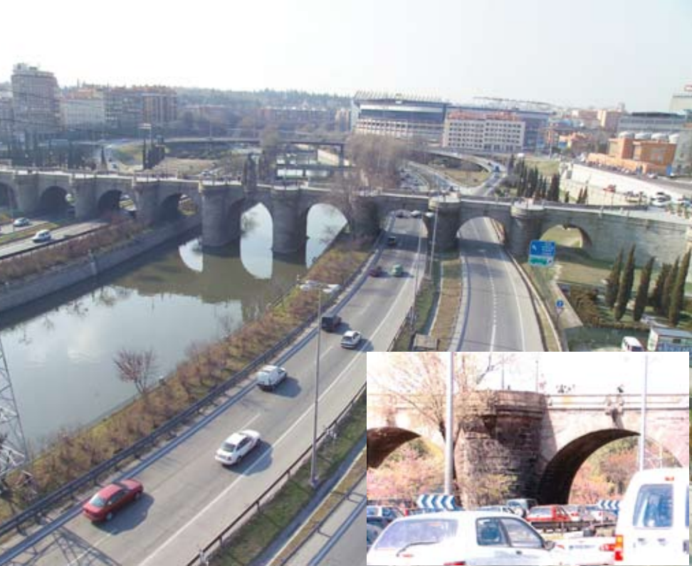
Año 2004: 200.000 vehículos circulando en ambos sentidos por los arcos del puente