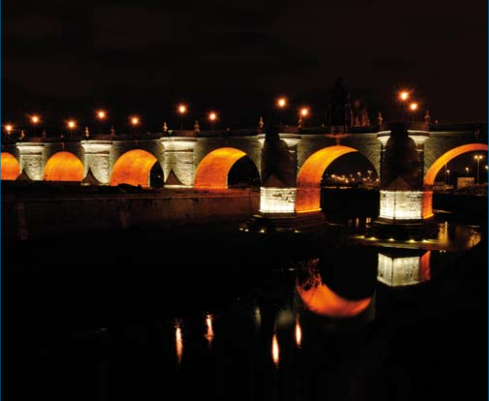
Año 2009: Iluminación monumental y remodelación del pavimento del puente