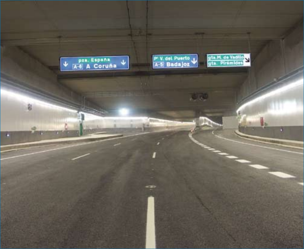
Túnel de Calle 30 a la altura del Puente de Toledo.