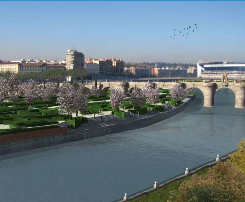
Año 2011: Recreación virtual del parque en superficie